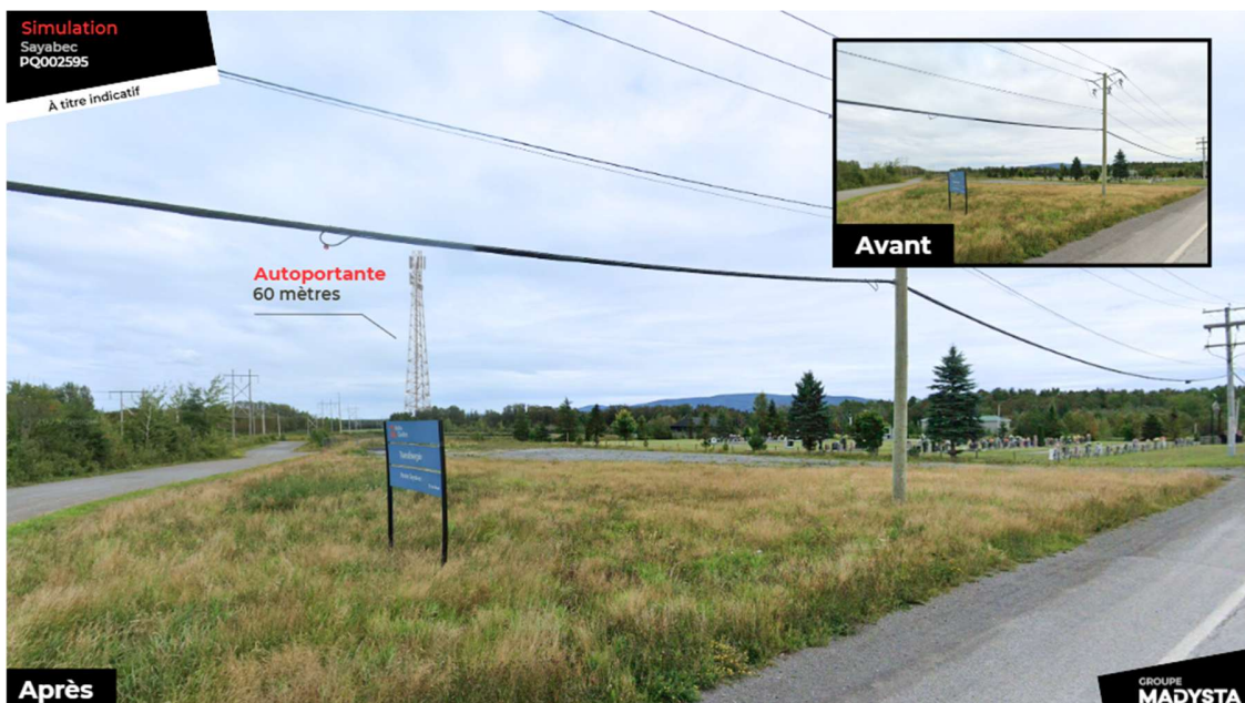
Vue depuis la route Rioux, depuis l'entrée au site