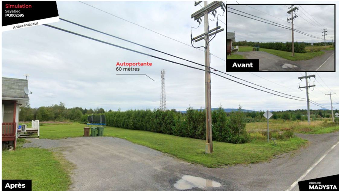
Vue depuis la route Rioux, direction sud